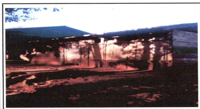
Foto 3: Se observa el mal estado de la puerta, tambien el deterioro del techo modulo 1 de la cocina