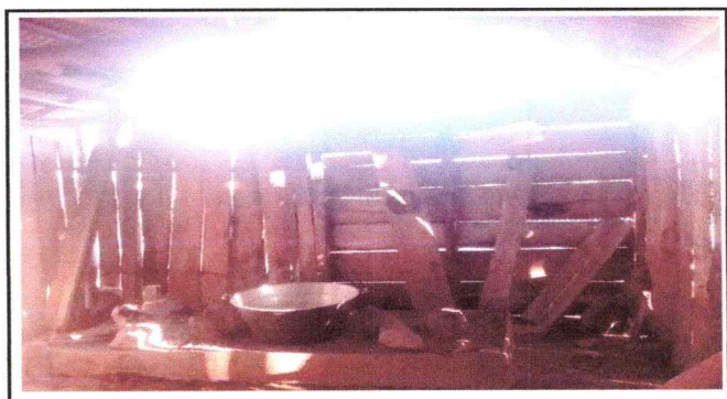
Foto 4: Se Observa el interior no cuenta con instalaciones adecuadas para la prepara cion de los alimentos, la falta de polleton y las estructuras en mal estado ya que solo esta hecho de madera temporales.