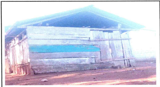
Foto1: Se observa el deterioro de estructura y techo así como tambien desprendimiento de las paredes por las polillas modulo 1 Cocina